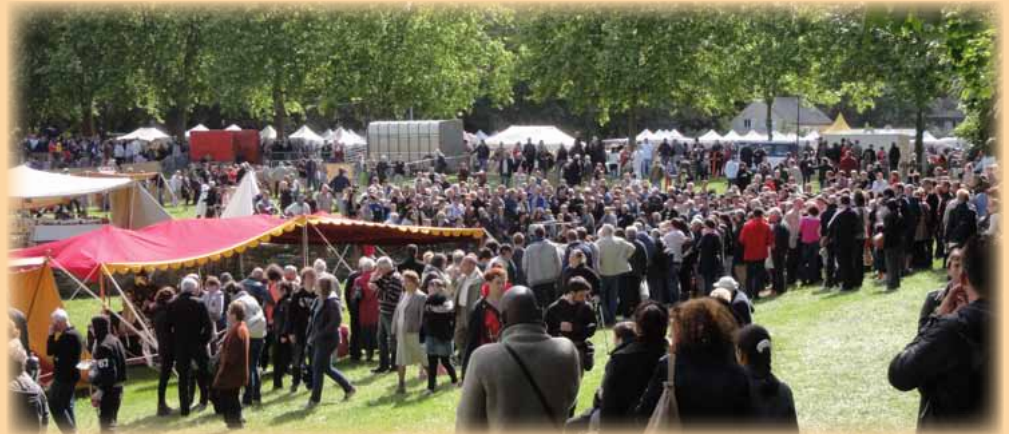
La foule au camp médiéval