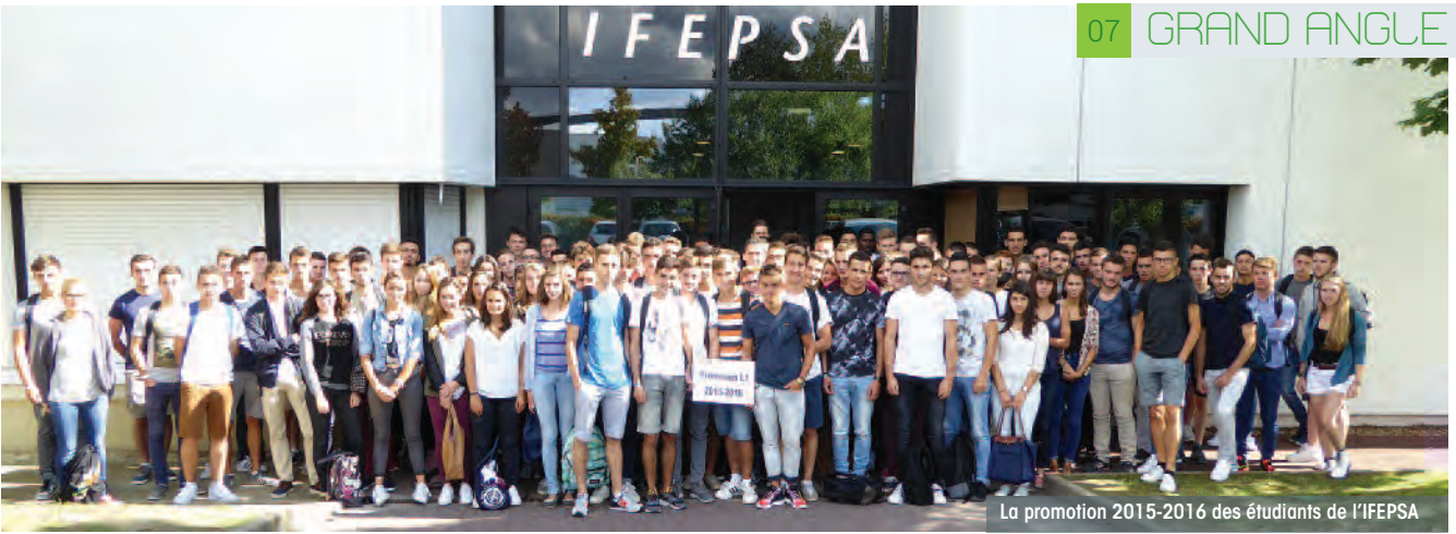
La promotion 2015-2016 des étudiants de l'IFEPSA