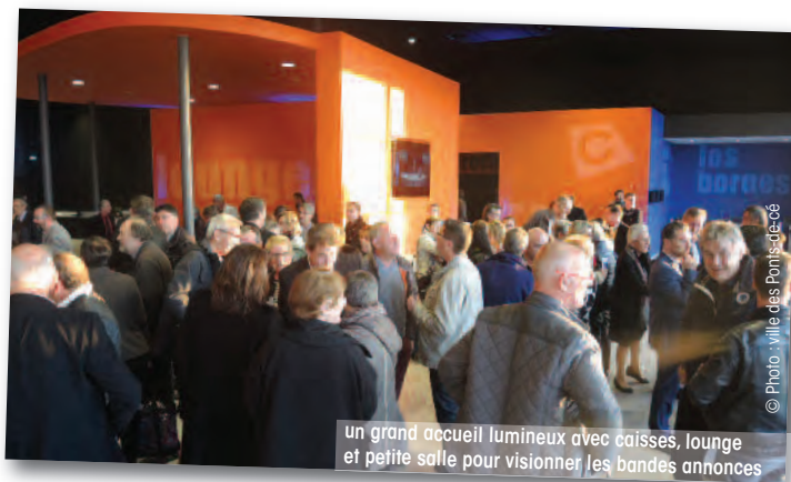
un grand accueil lumineux avec caisses, lounge et petite salle pour visionner les bandes annonces

Le cinéma compte 1158 fauteuils et 31 emplacements PMR, soit 1 189 places réparties dans 6 salles de 97 à 415 places. Toutes sont gradinées pour une meilleure vision et sont équipées de fauteuils club espacés de 1,20 m entre les rangées. Les spectateurs pourront patienter avant le début de leur séance dans une mini-salle de cinéma d'une trentaine de places qui diffusera des bandes-annonces sur un écran de 3,50 m. Les conditions de vision des films seront exceptionnelles : les salles sont équipées d'écrans de 10 à 18,50 m de base ! La qualité de l'image sera au rendez-vous : si toutes les salles sont bien entendu équipées de projecteurs numériques, notamment pour les films en 3D, elles sont aussi dotées d'une installation sonore de haut niveau, avec le son Trinnov Ovation 7.1 dans quatre salles, et le système révolutionnaire Dolby Atmos dans deux autres, qui permet au spectateur de vivre une expérience sonore immersive, la seule possible dans le département. La politique tarifaire adoptée par Cinéville s'échelonne de 3,90 € pour les séances Ciné-Bambino à 9,80 € pour le tarif plein adulte avec des possibilités d'abonnement attractives.