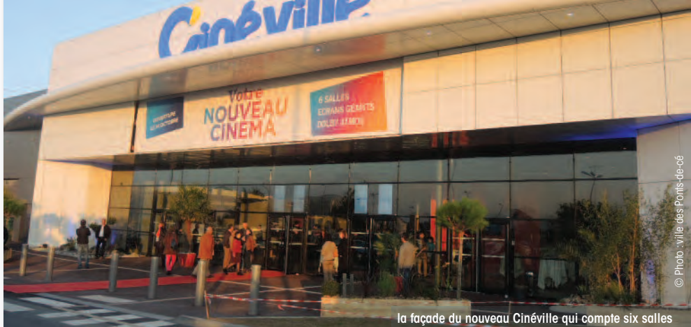
la façade du nouveau Cinéville qui compte six salles