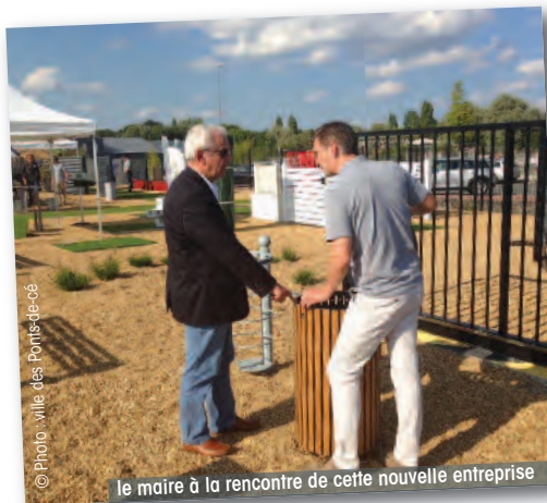
le maire à la rencontre de cette nouvelle entreprise

Déjà installée à Saint-Herblain, La Baule (44) et Aizenay (85) la société I.D. ENVIRONNEMENT, spécialiste en clôture, portail et motorisation s'installe dans la zone Florilore. Grâce à cette nouvelle agence, la société souhaite confirmer une proximité avec ses clients. Une zone d'exposition de 800m 2 est ouverte du lundi au vendredi de 8h à 12h et de 14h à 17h.