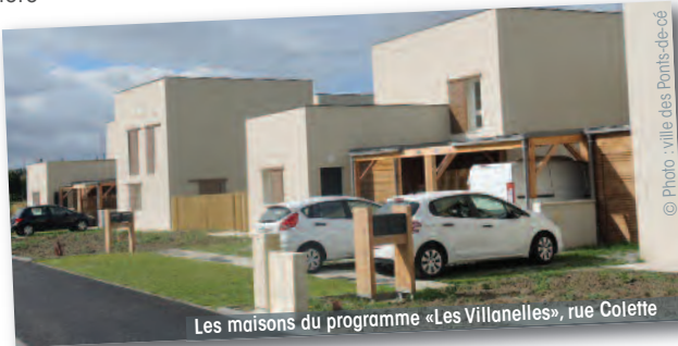
Les maisons du programme « Les Villanelles », rue Colette

Proposées par le groupe Procvivis-Ouest, elles ont déjà toutes trouvées preneurs.