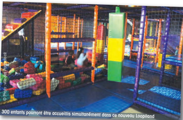
300 enfants pourront être accueillis simultanément dans ce nouveau Loopiland