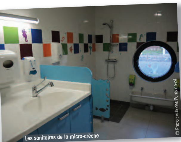
Les sanitaires de la micro-crèche