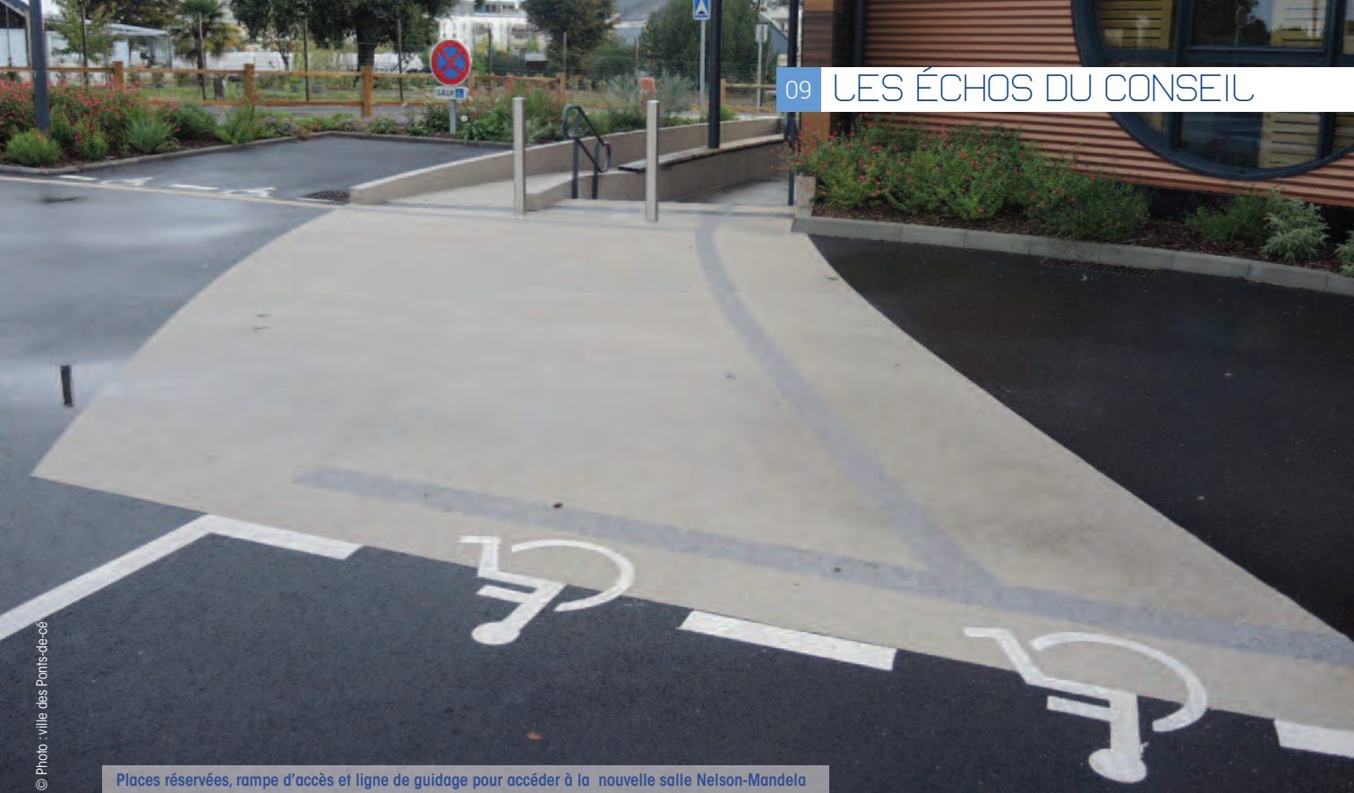
Places réservées, rampe d'accès et ligne de guidage pour accéder à la nouvelle salle Nelson-Mandela