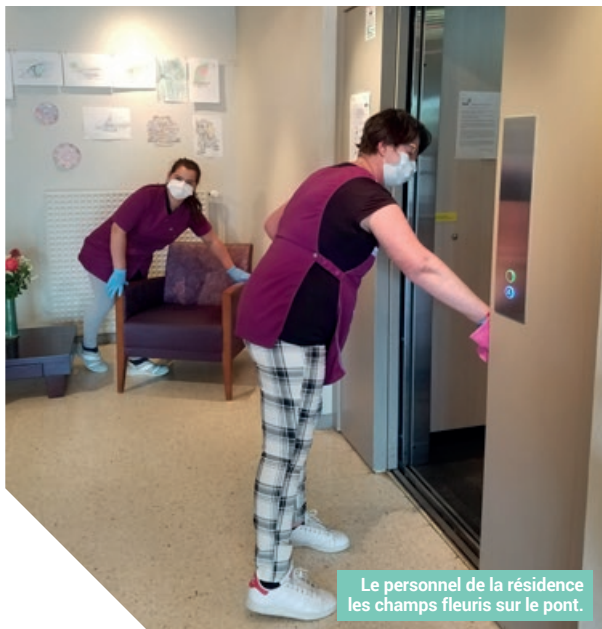
Le personnel de la résidence les champs fleuris sur le pont.

... A la hâte également, un centre médical COVID est aménagé quartier de La Chesnaie, il sert à accueillir les malades envoyés par les médecins traitants qui soupçonnent des signes de la maladie.