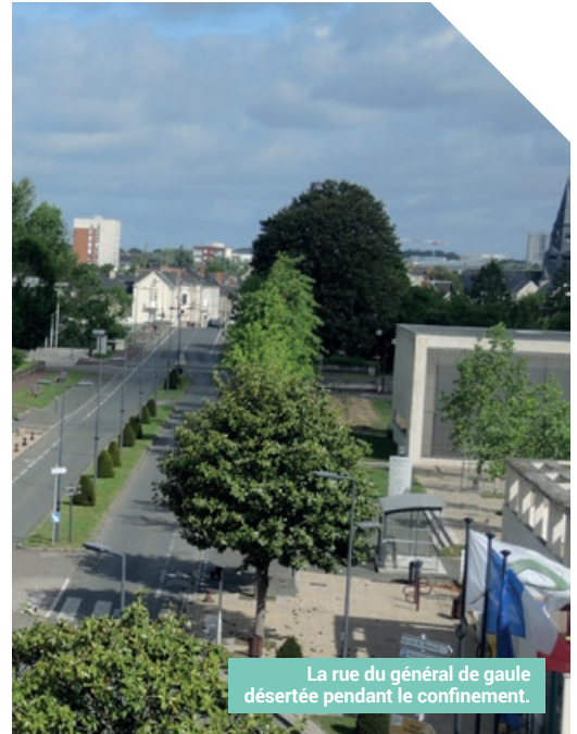
La rue du général de gaule désertée pendant le confinement.