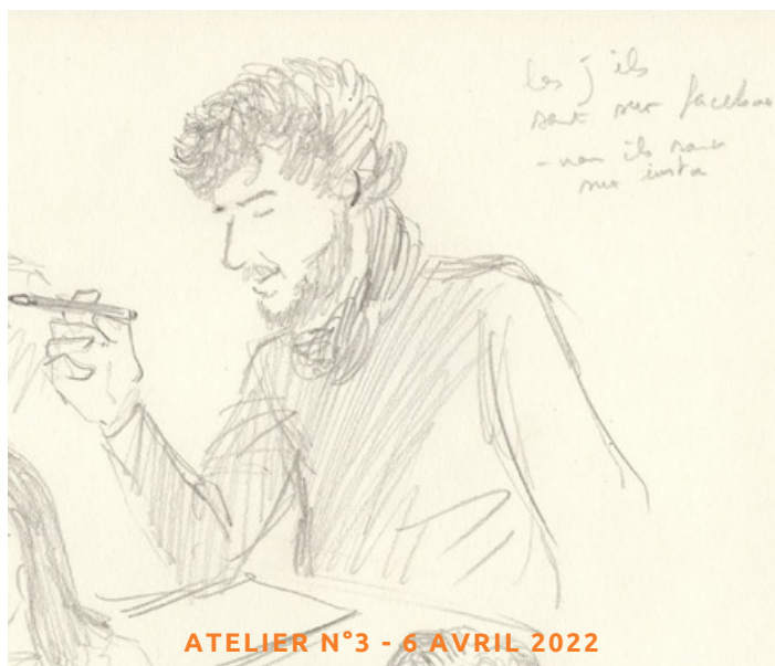
ATELIER N°3 - 6 AVRIL 2022

"L'objectif est de faire connaissance et accepter nos différences" (habitants)