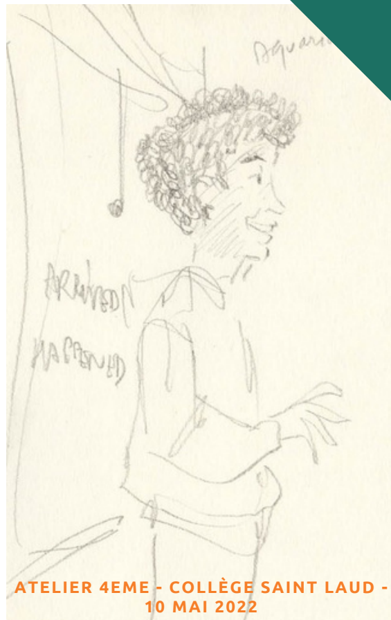
ATELIER 4EME - COLLÈGE SAINT LAUD - 10 MAI 2022

Les Ponts-de-Cé font ainsi partie de ces villes moyennes qui garantissent un bien-être territorial par la proximité, l'accessibilité à la nature, la facilité d'accès aux services, etc. Le projet culturel s'inscrit dans cette perspective de maintenir ce modèle réconfortant, de relier les populations, les générations, de franchir les ponts et de transformer les différences culturelles en diversités culturelles. Il invite ainsi chaque acteur - Ville, associations, habitants, professionnels - à se mettre en mouvement autour d'enjeux communs relatifs au partage et à la rencontre.