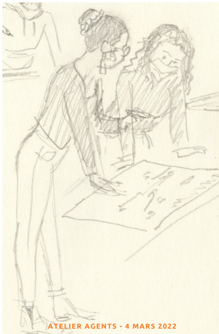
ATELIER AGENTS - 4 MARS 2022

"Nous devons intégrer dans tous les projets la notion d'enjeu climatique" (habitants)