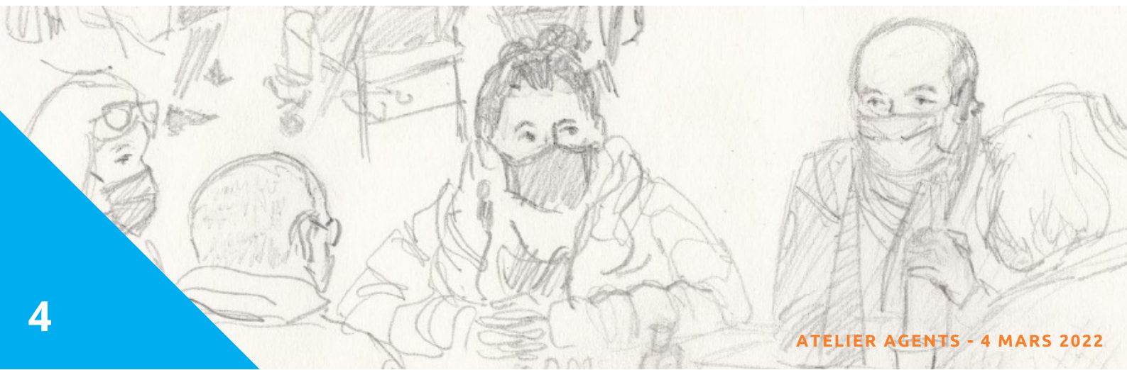
ATELIER AGENTS - 4 MARS 2022