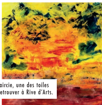
Éclaircie, une des toiles à retrouver à Rive d'Arts.

La peinture de FLO.B sera à l'honneur pour la prochaine exposition de Rive d'Arts du 25 mai au 30 juin. Inspiré par différents courants artistiques de l'art moderne, notamment la peinture impressionniste, lyrique et l'expressionnisme abstrait, FLO.B propose à un « art optimiste, vibrant et délibéré qui appelle à l'émotion et éveille les sens ». Grâce à des toiles aux