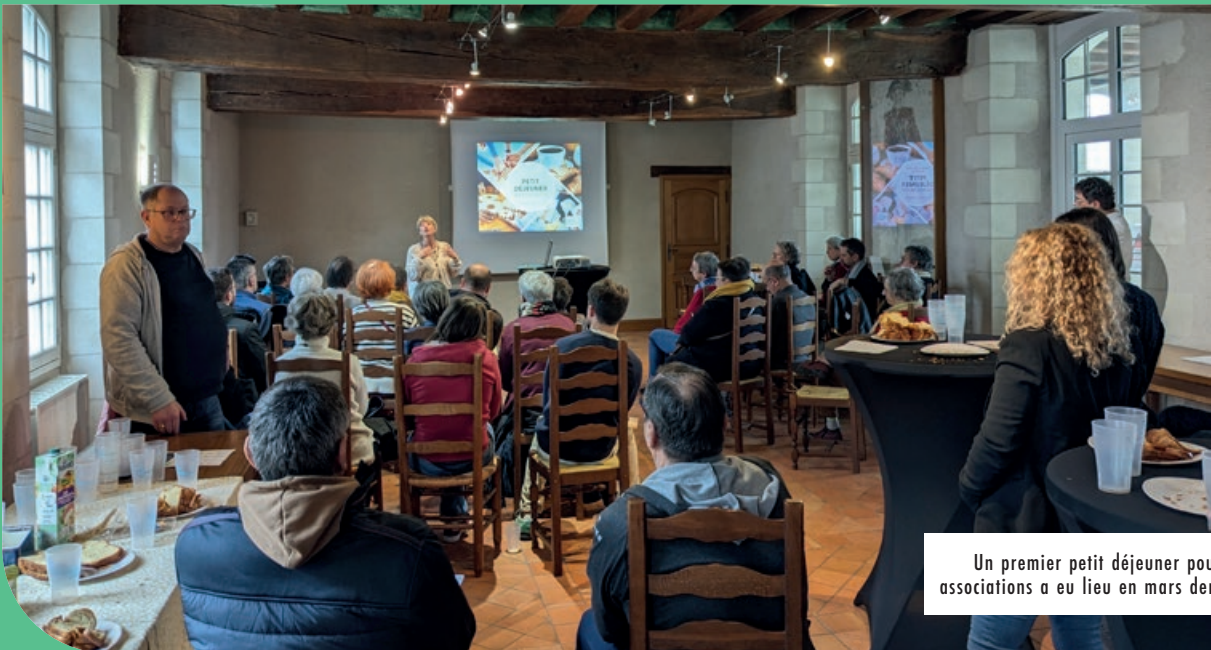
Un premier petit déjeuner pour les associations a eu lieu en mars dernier.

DEPUIS 2009, LA VILLE MET À DISPOSITION DES ASSOCIATIONS PONTS-DE-CÉAISES UN LIEU, LA MAISON DES ASSOCIATIONS, QUI PROPOSE DES SERVICES D'ACCOMPAGNEMENT. D'ICI À DEUX ANS, LA MAISON DES ASSOCIATIONS VA S'INSTALLER DANS DE NOUVEAUX LOCAUX PLUS ADAPTÉS À SES MISSIONS.