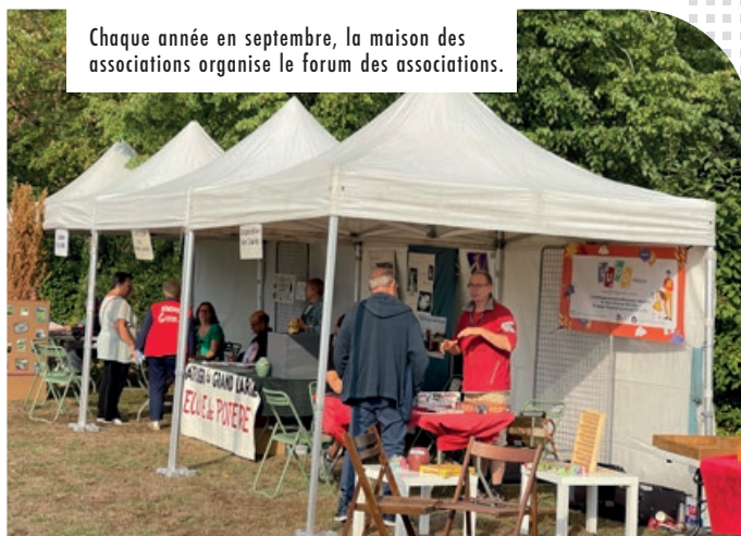
Chaque année en septembre, la maison des associations organise le forum des associations.