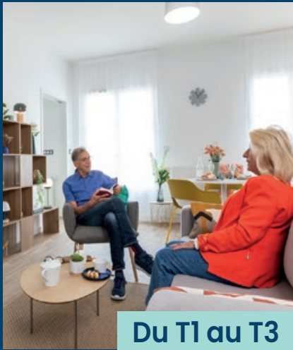
Du T1 au T3