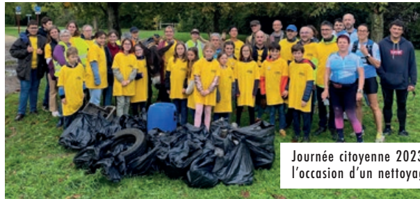
Journée citoyenne 2023 à l'occasion d'un nettoyage.

La municipalité vous propose de participer à une nouvelle édition de la journée citoyenne le samedi 5 octobre prochain. Cette journée permet de mener des actions au service de votre quartier ou de votre Ville en général (nettoyage, peinture, chantiers participatifs, actions de solidarité et de fraternité...). Si vous avez des idées d'actions à mener, vous pouvez en faire la proposition auprès de la maison des associations : 02 41 79 70 67 / maisondesassociations@ville-lespontsdece.fr