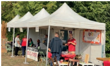
Une Maison et des services pour les associations