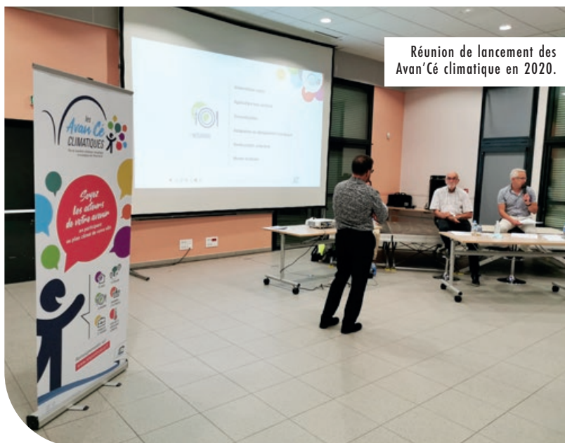
Réunion de lancement des Avan'Cé climatique en 2020.

LORS DE LA SÉANCE DU 28 MARS, LE CONSEIL MUNICIPAL A APPROUVÉ L'ENGAGEMENT DE LA VILLE DANS LE PROGRAMME «TERRITOIRE ENGAGÉ TRANSITION ÉCOLOGIQUE (TETE)» AFIN D'APPROFONDIR SA POLITIQUE DE TRANSITION ÉCOLOGIQUE.