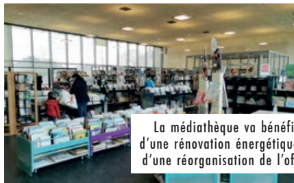
La médiathèque va bénéficier d'une rénovation énergétique et d'une réorganisation de l'offre.