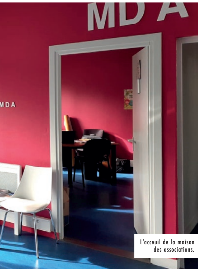
L'accueil de la maison des associations.