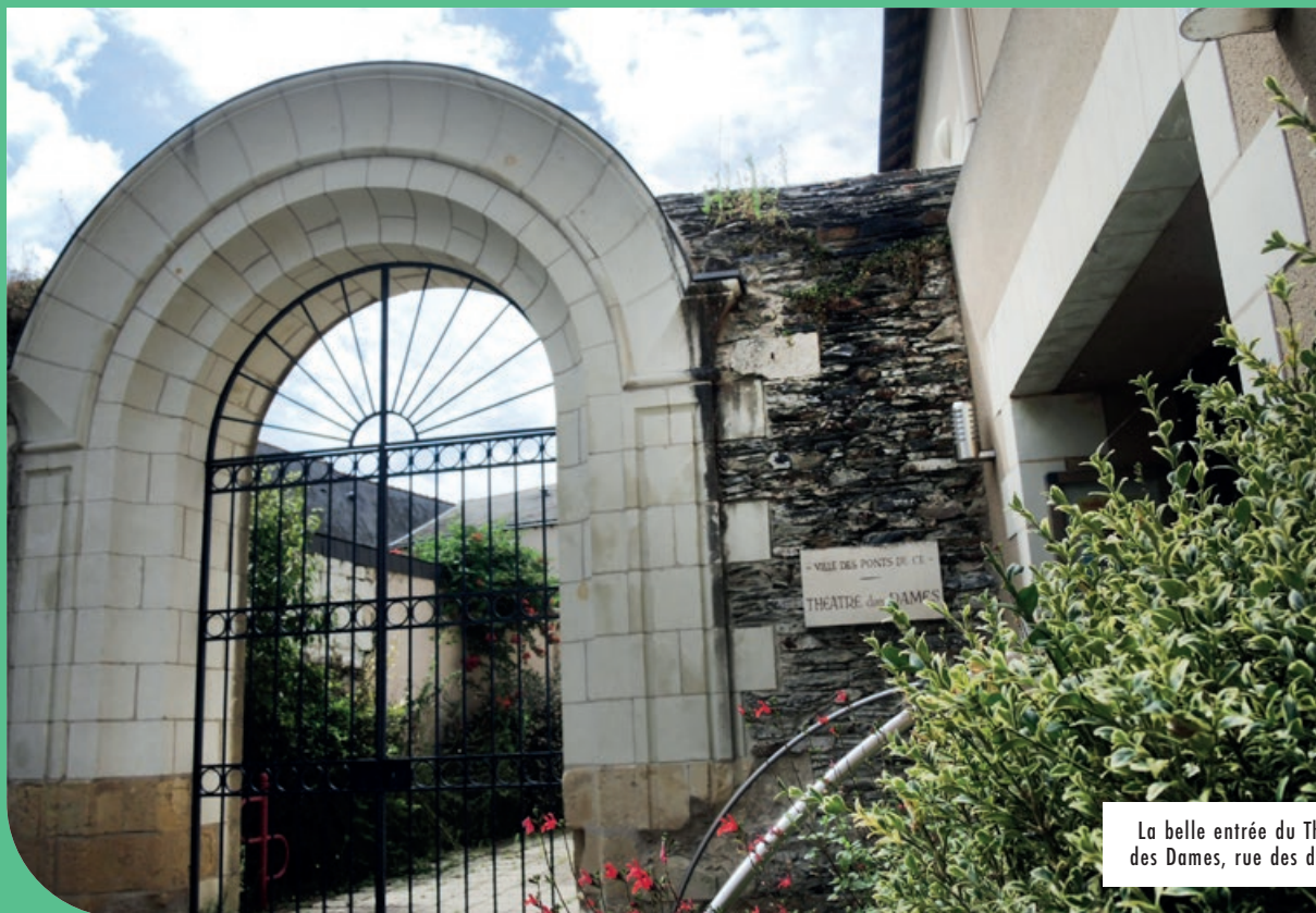
La belle entrée du Théâtre des Dames, rue des dames.

LE THÉÂTRE DES DAMES, PROPRIÉTÉ DE LA VILLE DEPUIS PRÈS DE 40 ANS, EST À LA FOIS UN LIEU DE DIFFUSION DES SPECTACLES DE LA SAISON CULTURELLE ET UN LIEU DE RÉSIDENCE POUR LES COMPAGNIES DE SPECTACLE VIVANT. LES ASSOCIATIONS PEUVENT AUSSI Y ORGANISER DES REPRÉSENTATIONS.