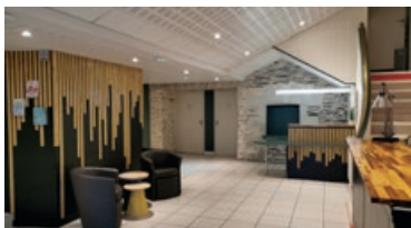
Le Théâtre des Dames