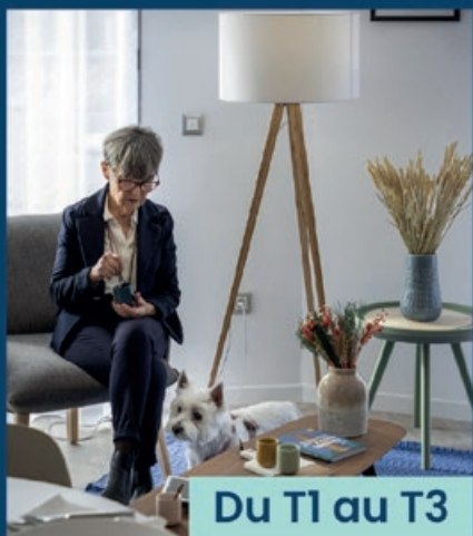
Du T1 au T3

les 28 et 29 mars lors des Portes Ouvertes de 9h à 18h